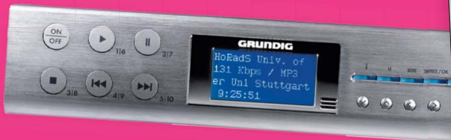
Grundig Sonoclock 890i WEB