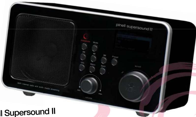
Pinell Supersound II